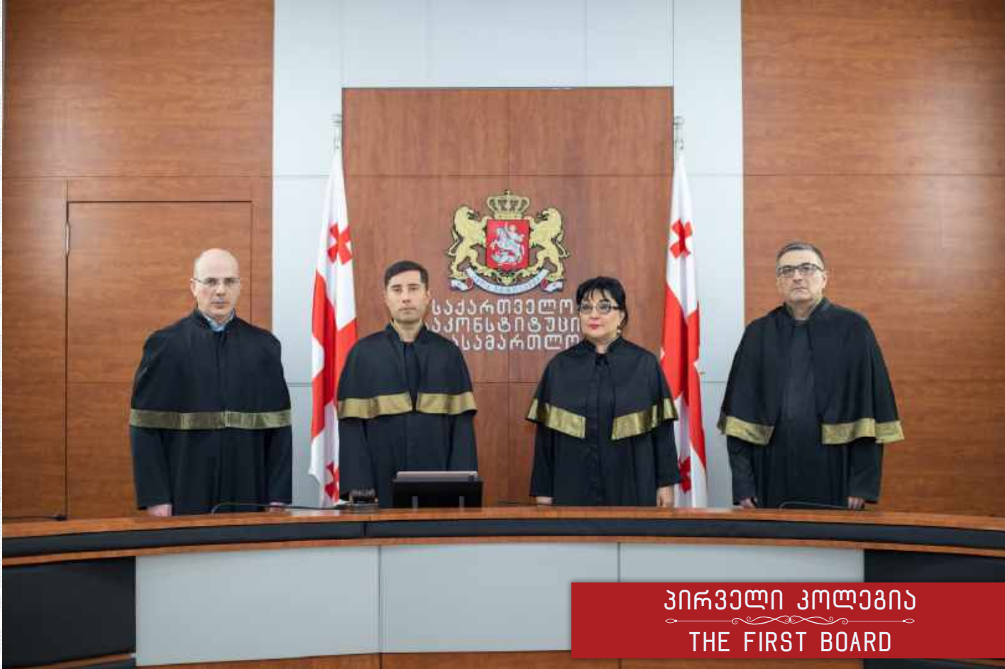
პირველი კოლეგია THE FIRST BOARD