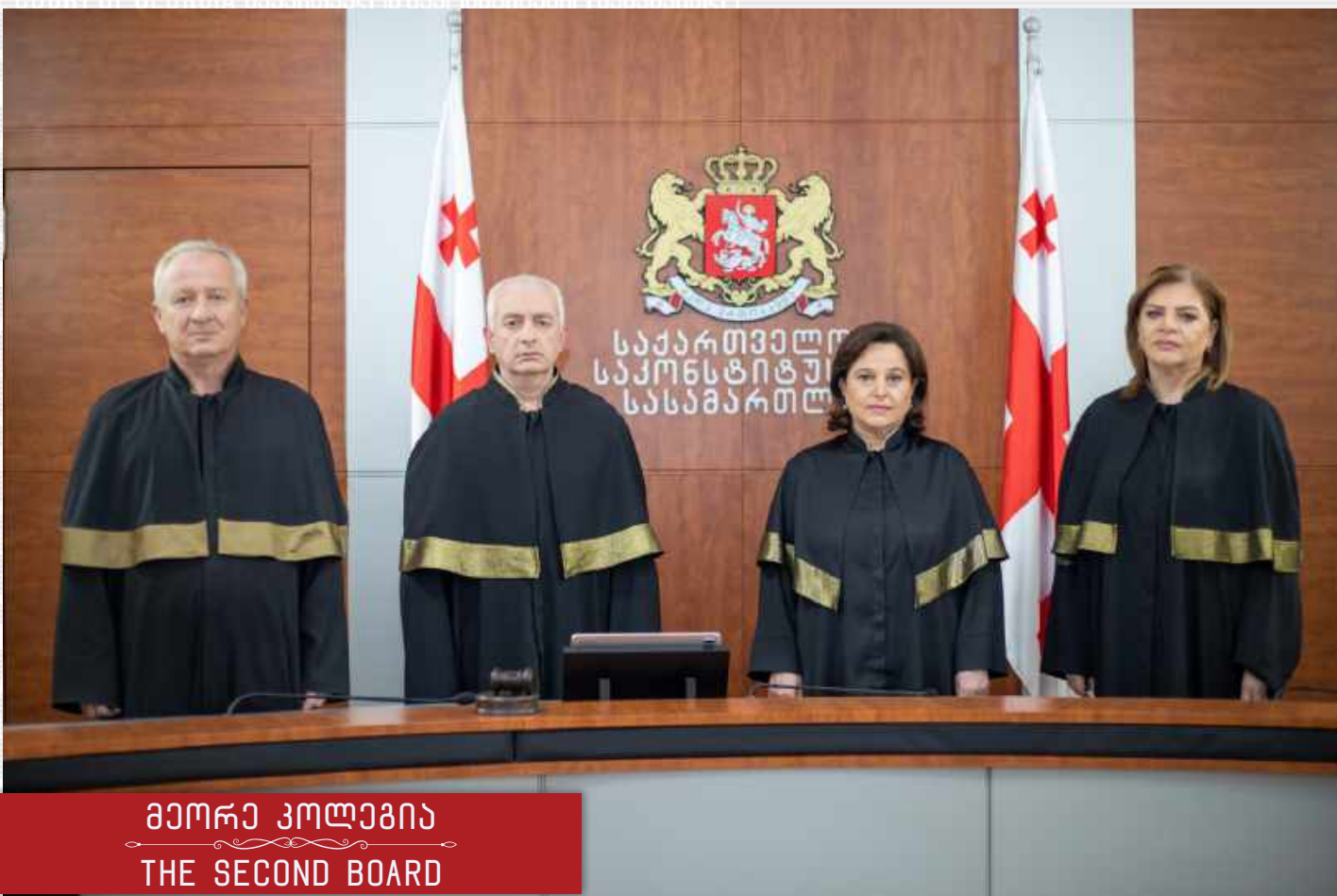
მეორე კოლეგია THE SECOND BOARD