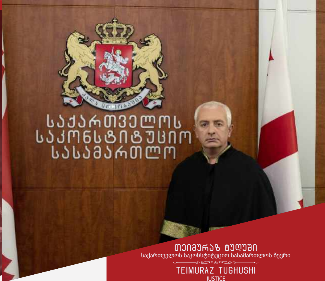
თეიმურაზ ტუღუში საქართველოს საკონსტიტუციო სასამართლოს წევრი TEIMURAZ TUGHUSHI JUSTICE

დაიბადა 1976 წლის 15 სექტემბერს ქ. ლანჩხუთში.